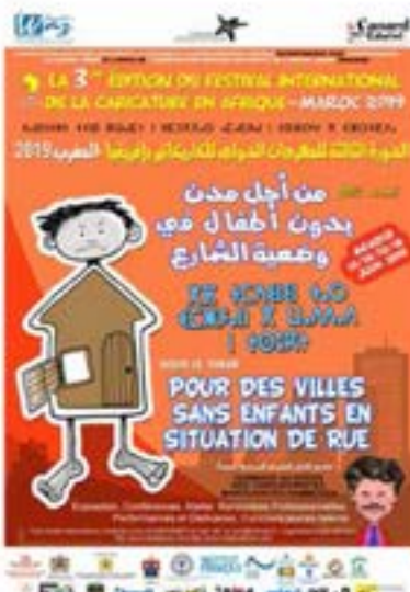
L'affiche du FICA organisé par l'association Waz et le Canard Libéré.