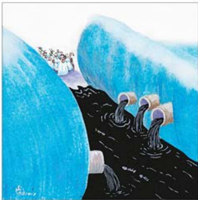
Semyon Cafrelli, Rusia. Una de las obras seleccionadas en el festival de Bucaramanga.

—¿Cómo surge la idea de un festival de caricatura en Bucaramanga?