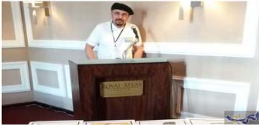
الغنان الكبير المغربي ناجي بناجي