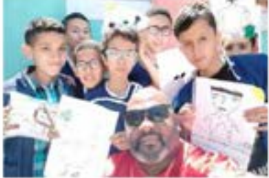
Le caricaturiste entouré d'un groupe d'enfants marocains férus de dessin.

des Marocains en est un fervent admirateur. Le portrait l'ouverture du festival, les nombreux artistes invités, ont été remerciés par des prix, un vibrant hommage posthume a été rendu à Hammouda, grand dessinateur marocain, par le biais de sa fille émue. Séquence émotion. Le FICA, toute une histoire on vous dit. Une belle histoire. Les enfants, maîtres de la manifesta-