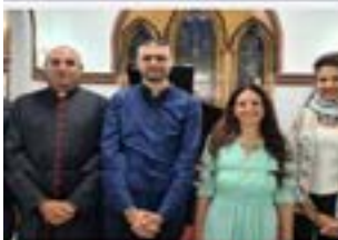
مخلل تكريسي لثقى سمونيل قنوس راهي الطفلة الانجليزية الاساقفية بالرملة