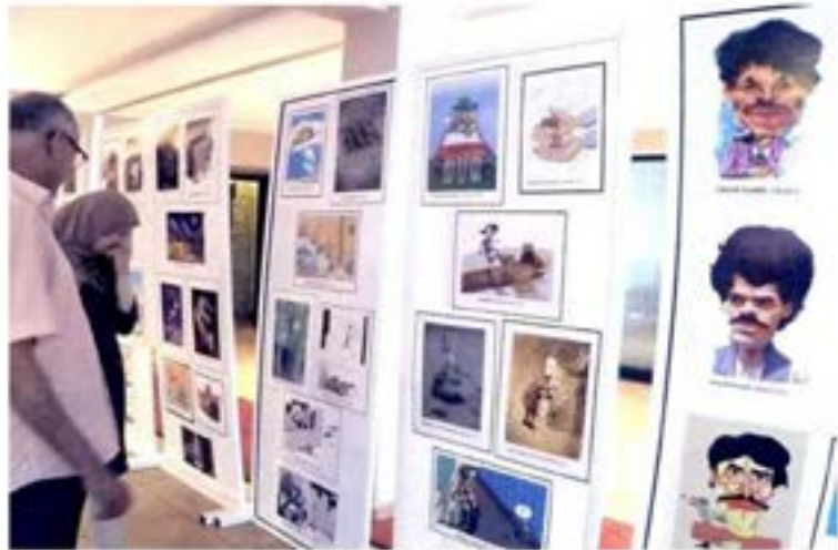
المهرجان الدولي للتأريخ والتراث المغربي العالبي الترائيل "المسجون"

الكاتب: أنفاس مديون | 09 يونيو 2019 | 17:34 | 62