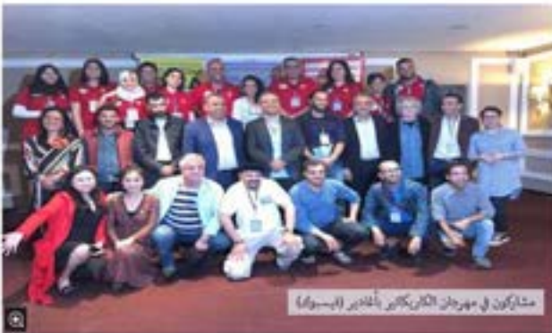
مشاركون في مهرجان الكاريكاتير بأغادير (اليسار)

الرئيسية | سياسة | اقتصاد | مجتمع | مبداء | تعليقات | ثقافة | رياضة | معرمات | مقالات | كاريكاتير | مقالات خاصة | صفحات متخصصة | المدونات | مرصا | كلمة البحث