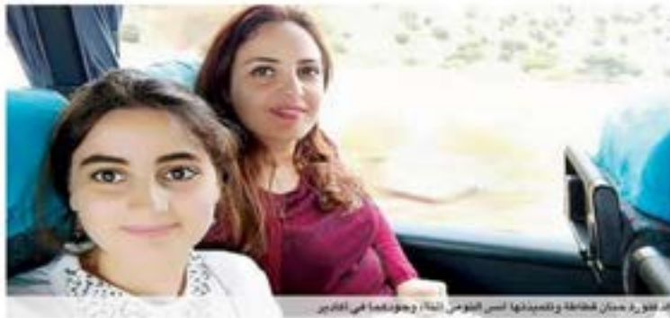
إله القور حضانة نشاطة وتلميذاتها آس البومون التاء، وهو نشاطة في أكادير

الجمعة - 21 شعبان 1439 هـ - 11 مايو 2018 برقم العدد | 21406