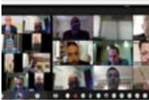
واقع حقوق الإنسان في ظل عهده منغير مؤنس لواتر بجامعة اربد