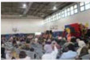
الصحافري بيت حيلنا يعانق بعد الانشعري